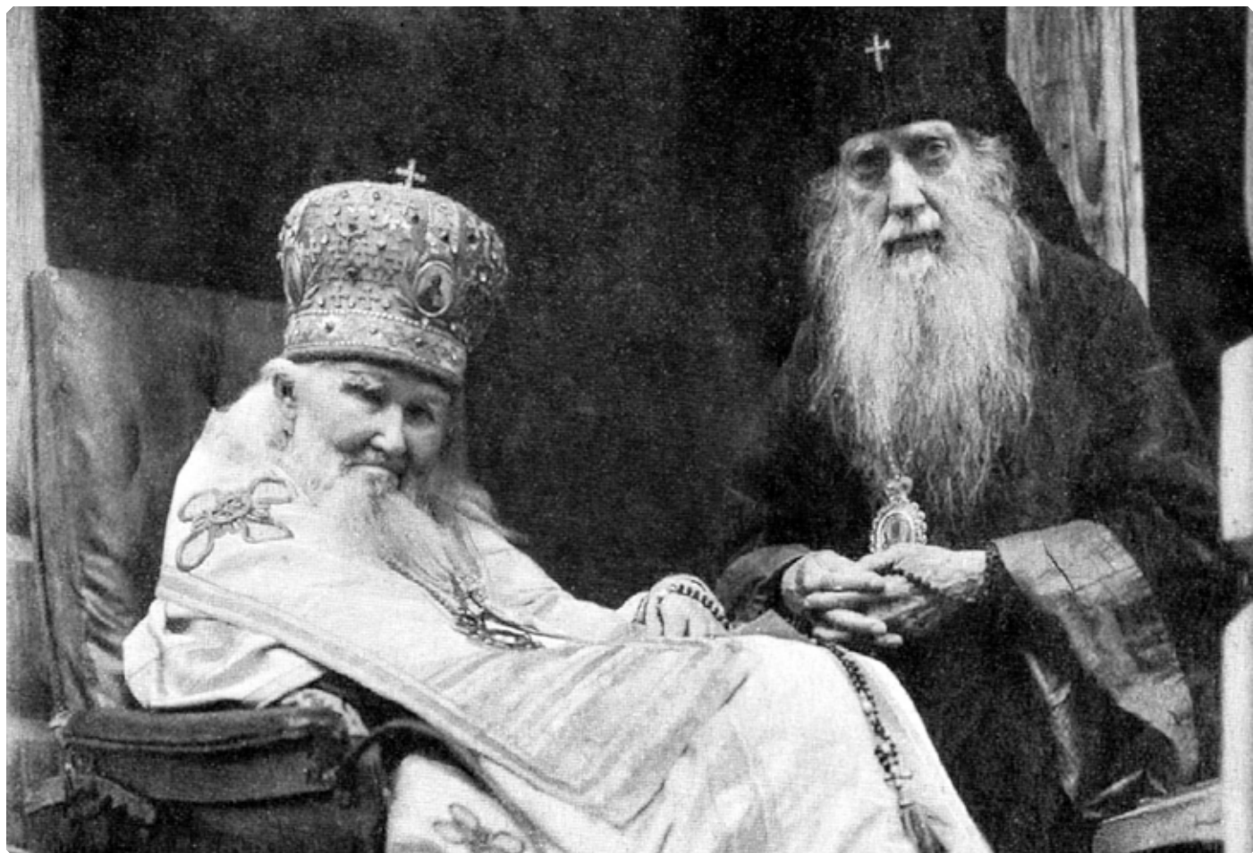
Митрополит Макарий (Невский) и архиепископ Бийский и Алтайский Иннокентий (Соколов). Начало 1920-х гг. (не ранее 1922 г.)

[1] Акты Святейшего Тихона, Патриарха Московского и всея России, позднейшие документы и переписка о каноническом преемстве высшей церковной власти (1917–1943 гг.): Сб. в 2 ч. / Сост. М.Е. Губонин. – Москва: Изд-во ПСТБИ, 1994. – 1063 с.