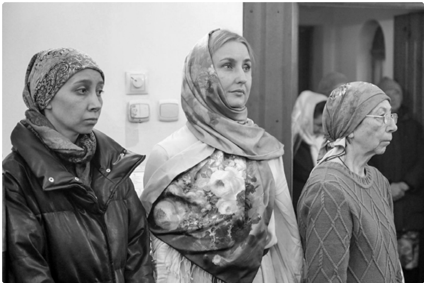
Прихожанки храма святой мученицы Татианы. Село Новотырышкино. 28 декабря 2025 г.