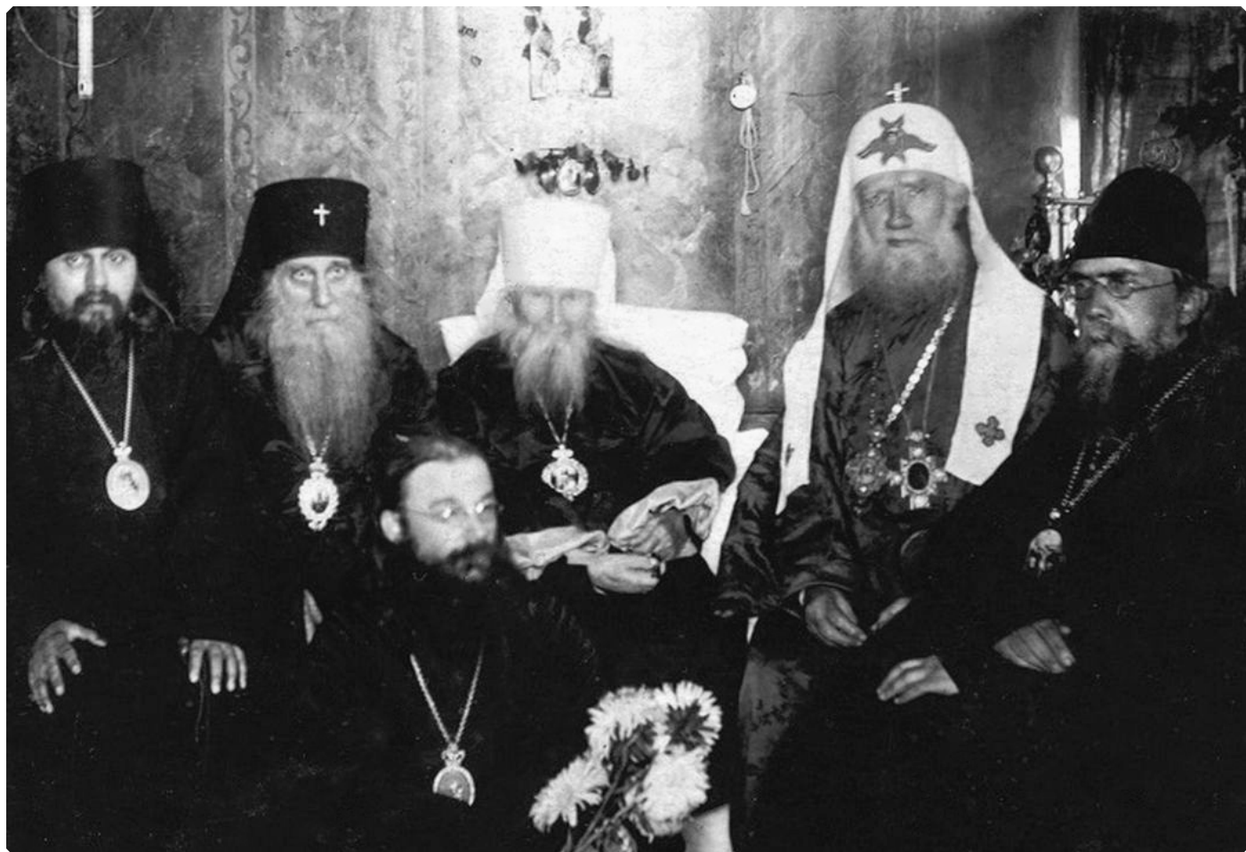
Святейший Патриарх Тихон в гостях у бывшего митрополита Московского и Коломенского Макария (Невского). На фото слева направо: епископ Серпуховский Арсений (Жадановский), архиепископ Бийский Иннокентий (Соколов), митрополит Макарий Алтайский (Невский), Святейший Патриарх Тихон, епископ Звенигородский Николай (Добронравов); с цветами – епископ Волоколамский Феодор (Поздеевский). Николо-Угрешский монастырь. 21–22 августа 1924 года.

«Высокопреосвященнейший Владыко, возлюбленный о Христе брат!