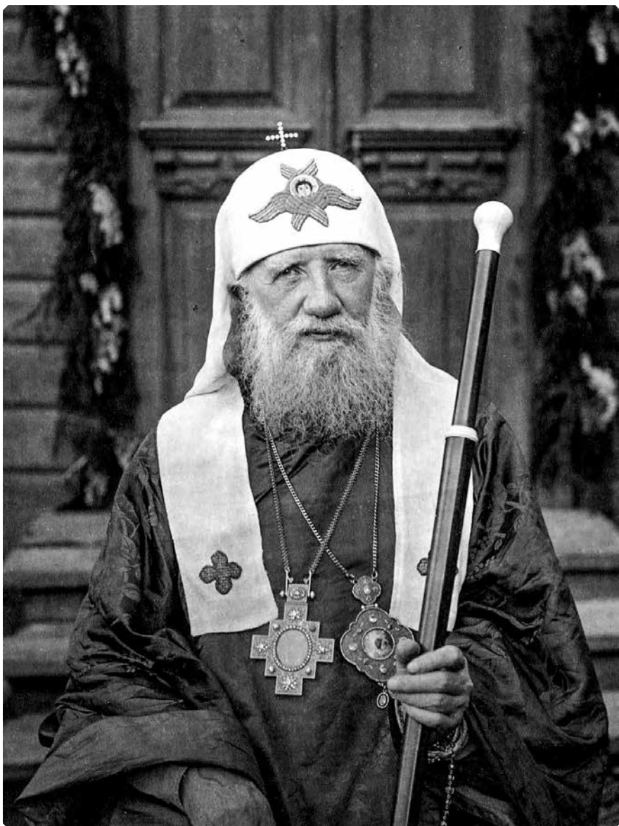
Святитель Тихон, Патриарх Московский и всея России