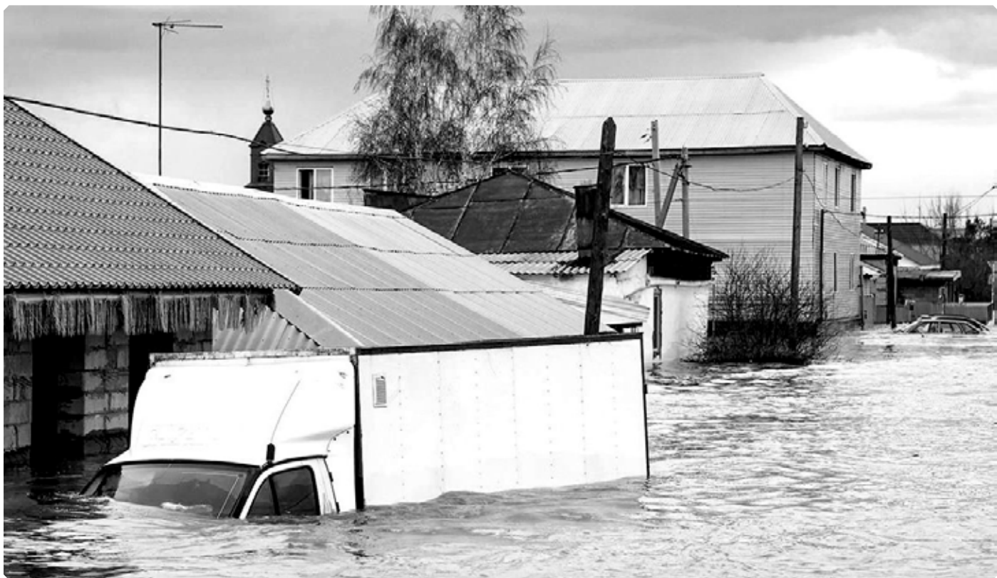
Микрорайон Старый город. Город Орск. Апрель 2024 г.