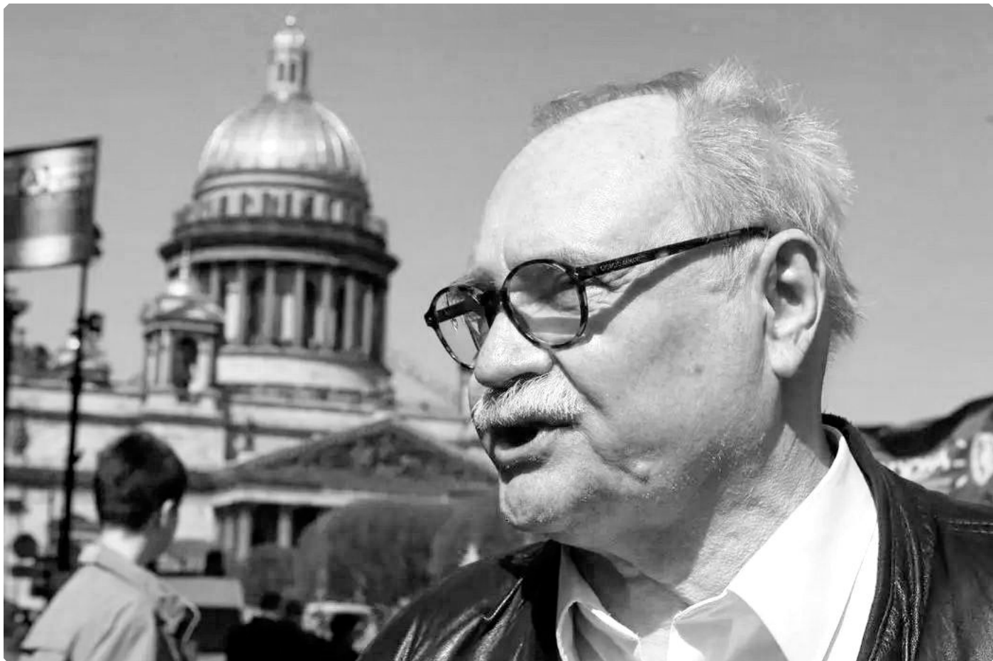
Владимир Владимирович Бортко.