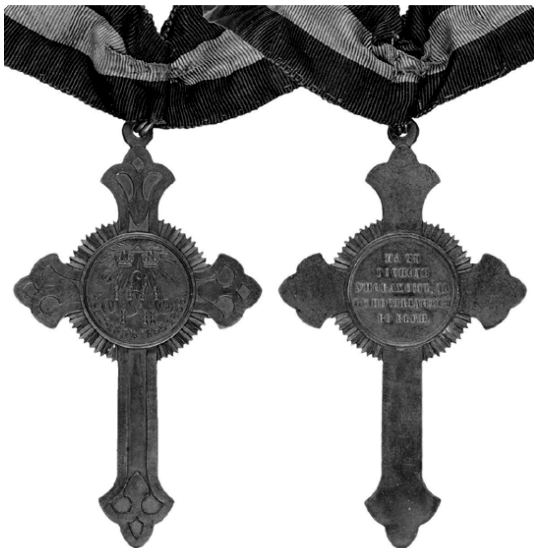
Наградной наперсный крест «В память войны 1853–1856» – лицевая и обратная стороны. На последней надпись: «На Тя, Господи, уповахом, да не постыдимся во веки».