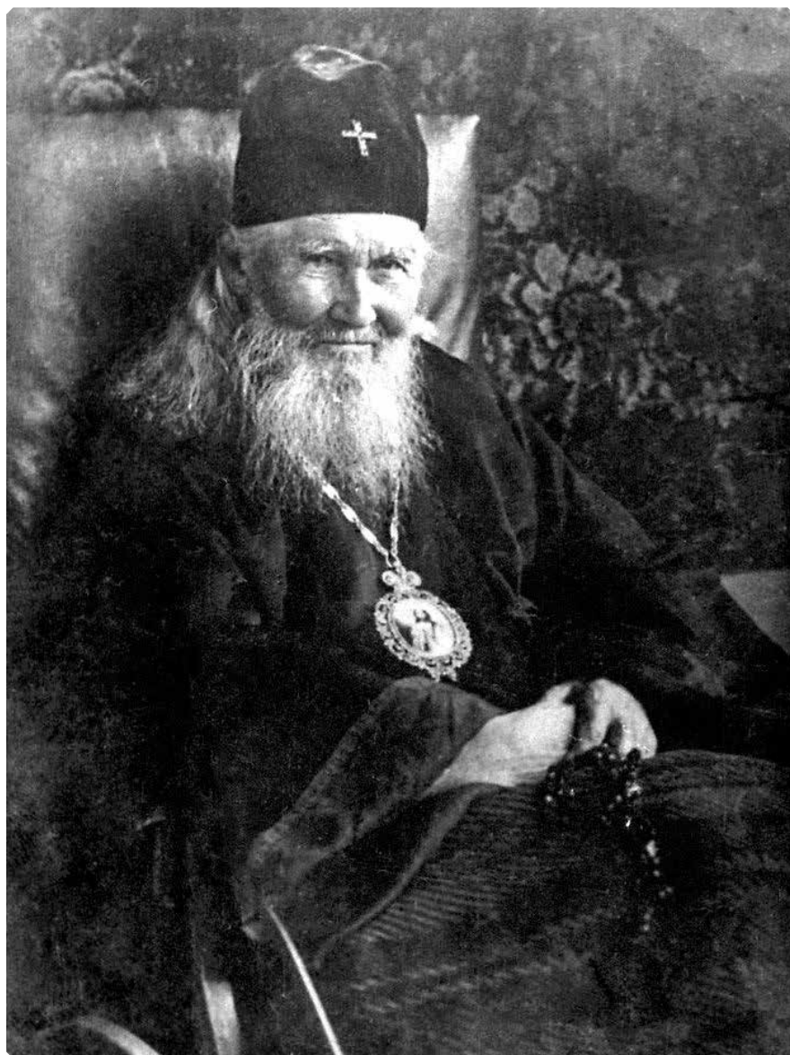
Митрополит Макарий в последние годы жизни

Как известно из жития святителя Макария, постановлением от 20 марта 1917 года Святейший Синод под давлением обер-прокурора В.Н. Львова (впоследствии порвавшего с Православной Церковью) решил уволить митрополита Макария Московского на покой за преклонностью лет. Ни в Свято-Троицкой Сергиевой Лавре, ни в Зосимовой